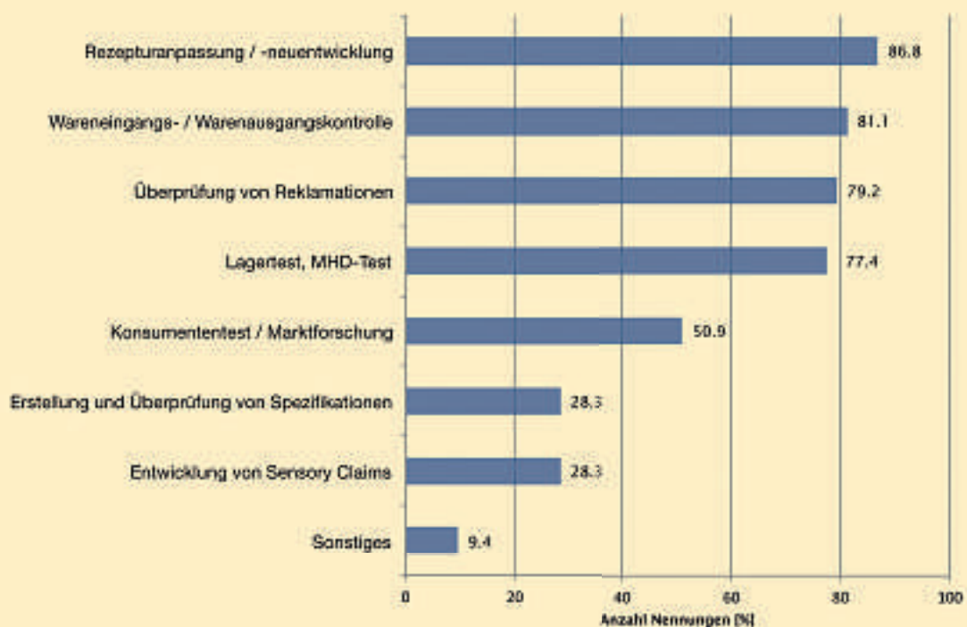
Abb. 1: Anwendungsfelder sensorischer Methoden (n=53), Mehrfachnennungen waren möglich

Anwendungsfelder der Sensorik. Die Umfrage zeigt, dass Fragestellungen, die mit Hilfe sensorischer Methoden bearbeitet werden, überwiegend aus dem Bereich der Produktentwick-